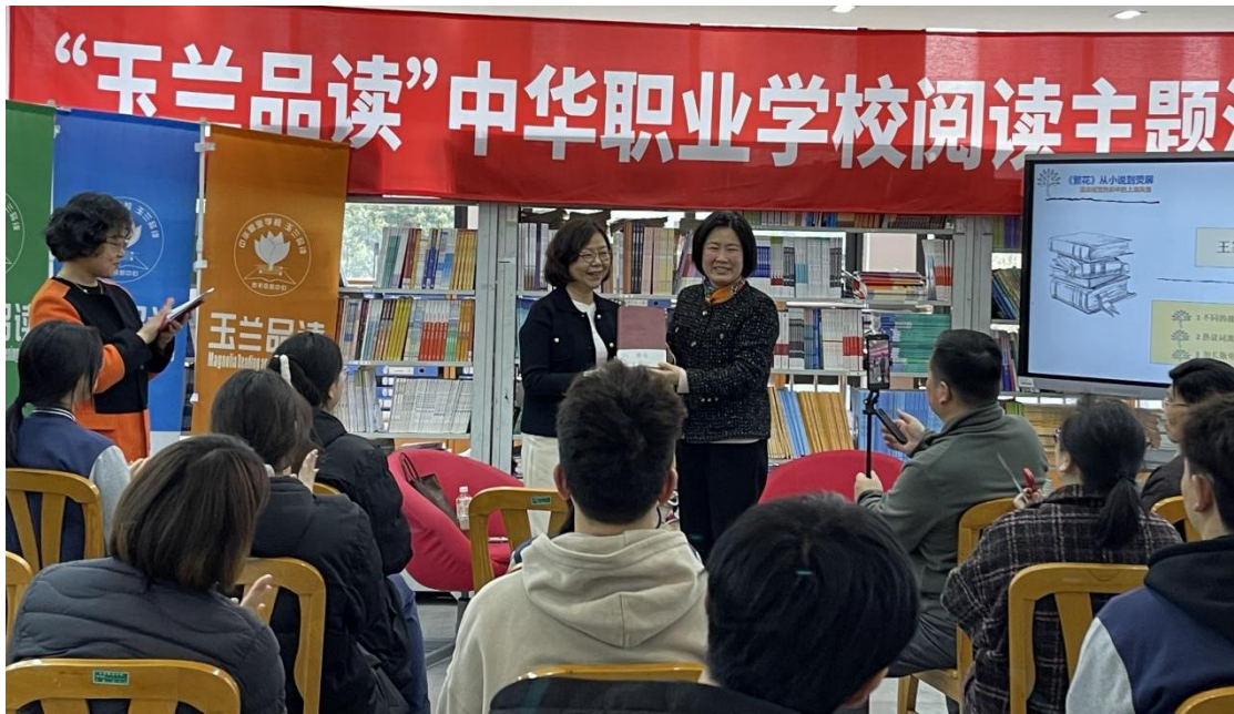
图 14：“《繁花》中的上海风情”导读分享会