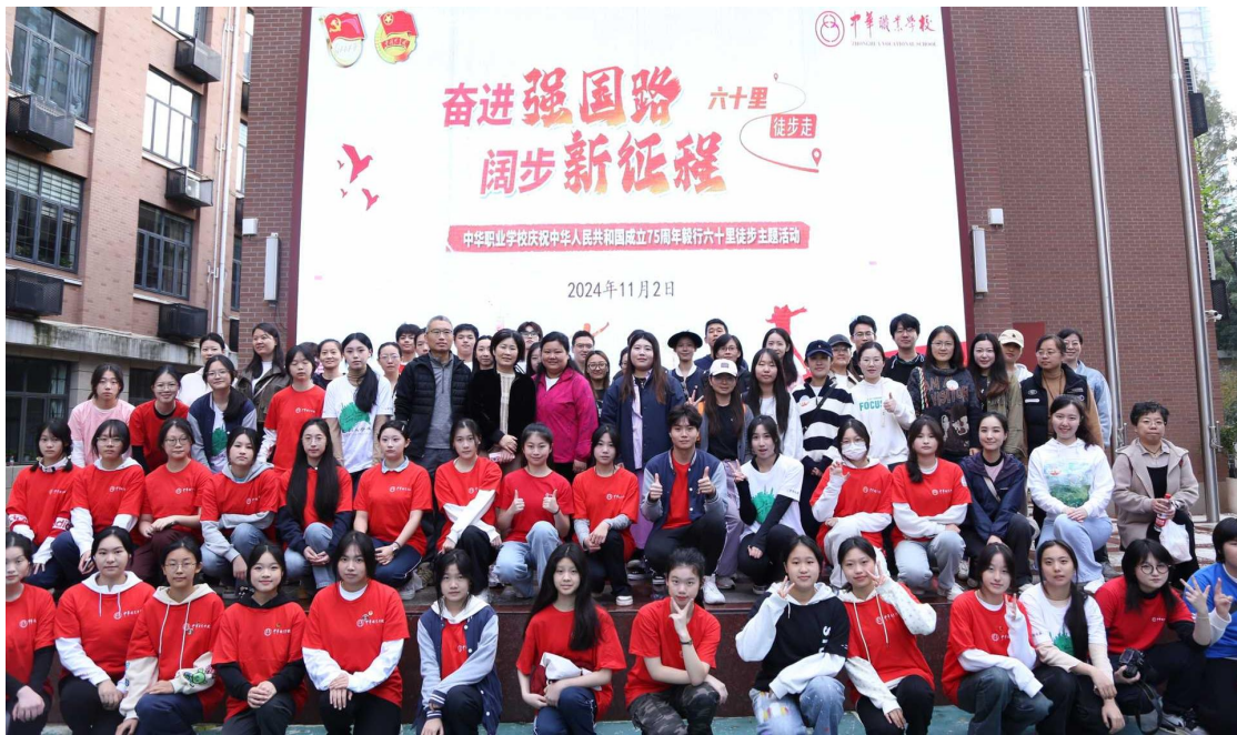
图 1：毅行六十里徒步主题活动师生志愿者合影

以《中学生日常行为规范》《中等职业学校学生公约》为抓手，加强行为规范养成教育，建设良好校风。开展新生入学教育、法治教育宣传周、安全教育培训、“团聚青年力量，激活青春动能”爱创集市义卖、毅行六十里徒步等活动，举办“玉兰花开 艺熠生辉”——庆祝中华人民共和国成立75周年暨中华职业学校2024年白玉兰校园文化艺术节、“青春为中国式现代化挺膺担当”成人仪式。学生在校园文化的熏陶中，在教师的教育和引导下，本着“健康第一”，向着“做最好的自己”，实现个人自我成长。