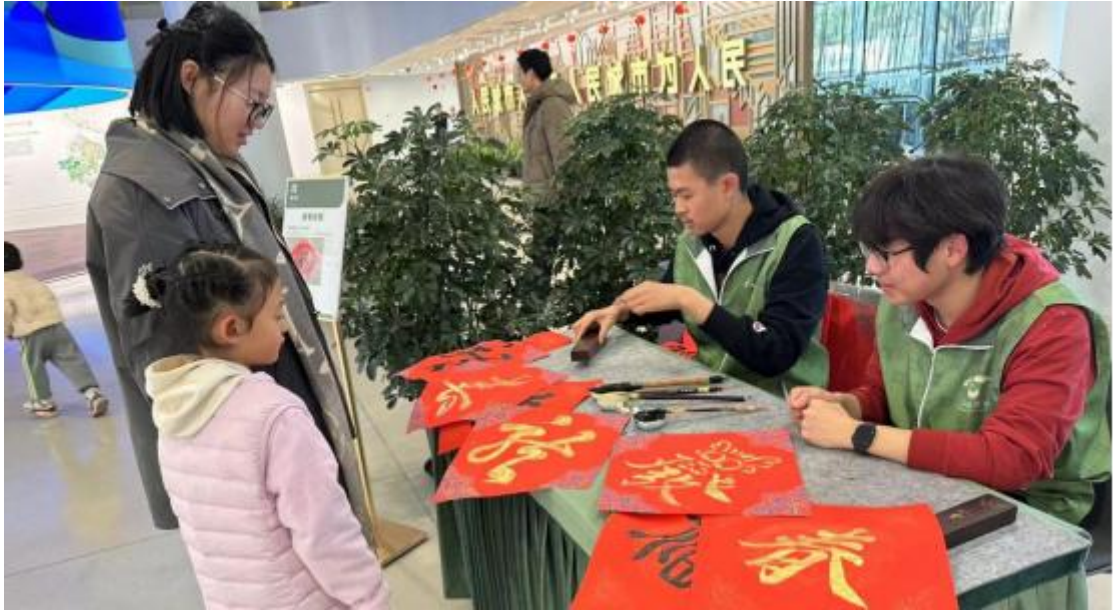
图 10：学生志愿服务上海城市规划展示馆新春送福活动