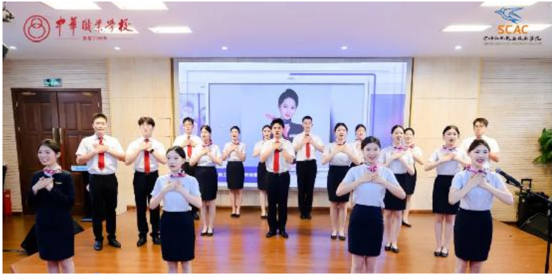
图 6：航空服务专业群中高贯通培养十周年纪念活动上学生展示

探索现代学徒制试点，休闲体育服务与管理专业与上海棕榈滩海景高尔夫俱乐部合作培养 2021 级“棕榈滩班”，实现双元主体招生，学生具有学生和企业准员工双重身份，开发了 3 个特色课程。影视动画专业与今日动画和惊浪传媒公司共建 2023 级“金格”动画班，中华·上电·惊浪“金格动画学徒班”高水平产教融合实践基地揭牌。航空服务专业、计算机网络技术专业开展“1+X”证书试点。