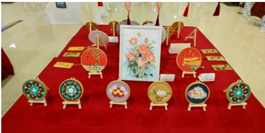
图 5：2024 年 6 月文化创意专业群教学成果展上部分学生作品

精心打造专业品牌活动，如视觉传达设计、影视动画、艺术设计与制作、舞台设计与制作专业的大师课堂、学生艺术观摩、毕业季学生作品展，烹饪专业的大师授帽仪式、李锦记奖学金颁奖典礼，航空服务专业的外语节、企业实践课程，戏剧表演专业的艺术云视野、专业展演，休闲体育服务与管理专业的企业课程，计算机网络技术专业的校企合作工作室，幼儿保育专业的国际早教课程、专业展示以及岗位实践等。