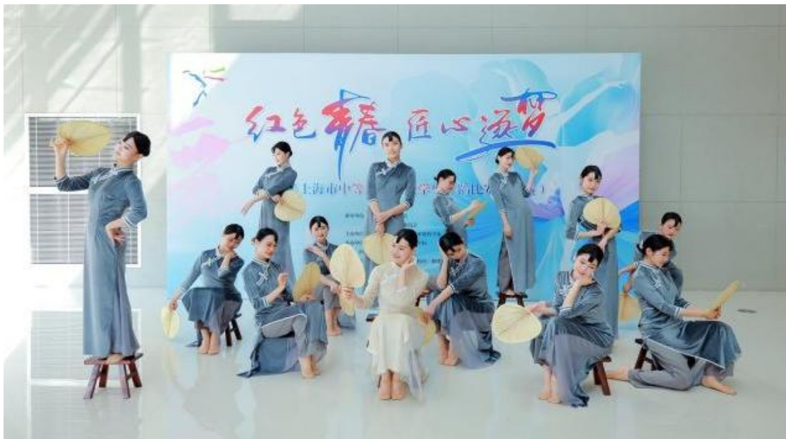
图 15：舞蹈社团学生《晨光曲》造型合影

舞蹈“新手”到舞台“新星”的华丽转身。《晨光曲》的排练，也是学校将立德树人，将德育融入到艺术教育工作中，是五育融合的举措。