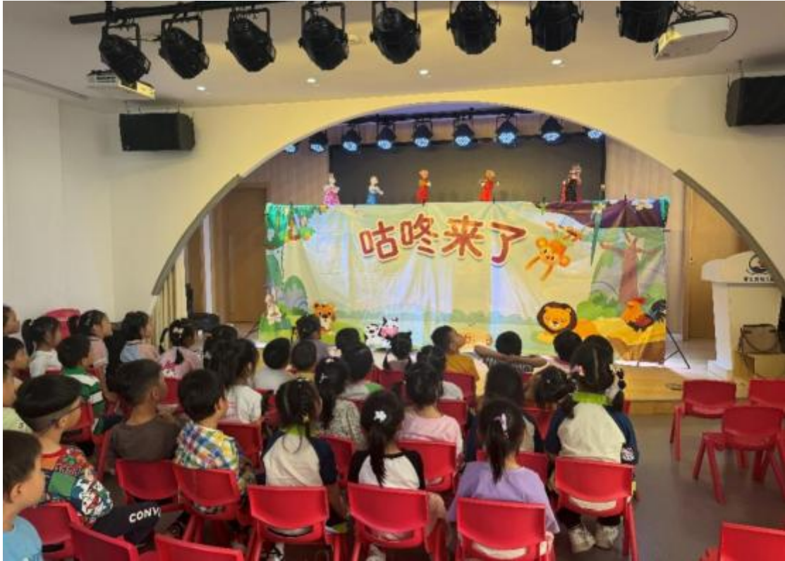
图 17：幼儿保育专业学生木偶剧“咕咚来了”在幼儿园巡演