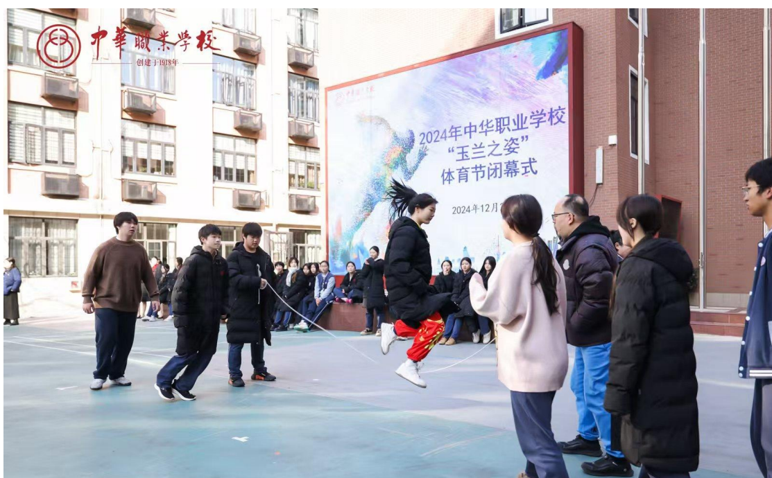
图 2：2024 年 12 月体育节长绳比赛决赛

重视学生身心健康。校心理关爱中心配备有2名专职心理教师，区心理工作站在校挂牌，共同开展对学生不良心理的防范、教育和干预。开展温馨教室创建活动，对新一年级各班开展团队建设活动。3月启动“关爱心灵之光 共筑健康未来”心理健康教育活动季，聚焦学生生命成长，加强人文关怀和心理疏导。卫生室配备有2名专职校医，建立学生健康档案，做好疾病防控工作，定时开展健康宣传教育。认真落实“三课两操两活动”和“每天一小时校园体育活动”要求，课余开设武术、舞龙、花样跳绳等体育社团，开展广播操比赛、冬锻月系列活动等，学生体质健康达到《国家学生体质健康标准》。上海市学生阳光体育大联赛跳绳踢毽、武术、校园啦啦操、田径等项目获多个奖项。