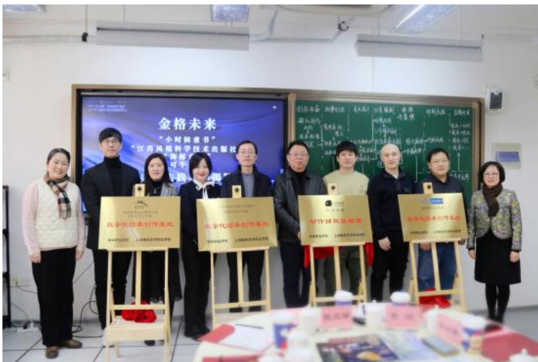
图 18：中华·上电·惊浪“金格动画”高水平产教融合实践基地揭牌

影视动画专业与今日动画和惊浪传媒公司合作开展现代学徒制试点项目，共建 2023 级“金格”动画班。2024 年 1 月，“初心·展翅·金格”——中华·上电·惊浪“金格动画学徒班”高水平产教融合实践基地揭牌仪式暨学徒制建设专题研讨会在学校影视动画专业产学研创中心举行。