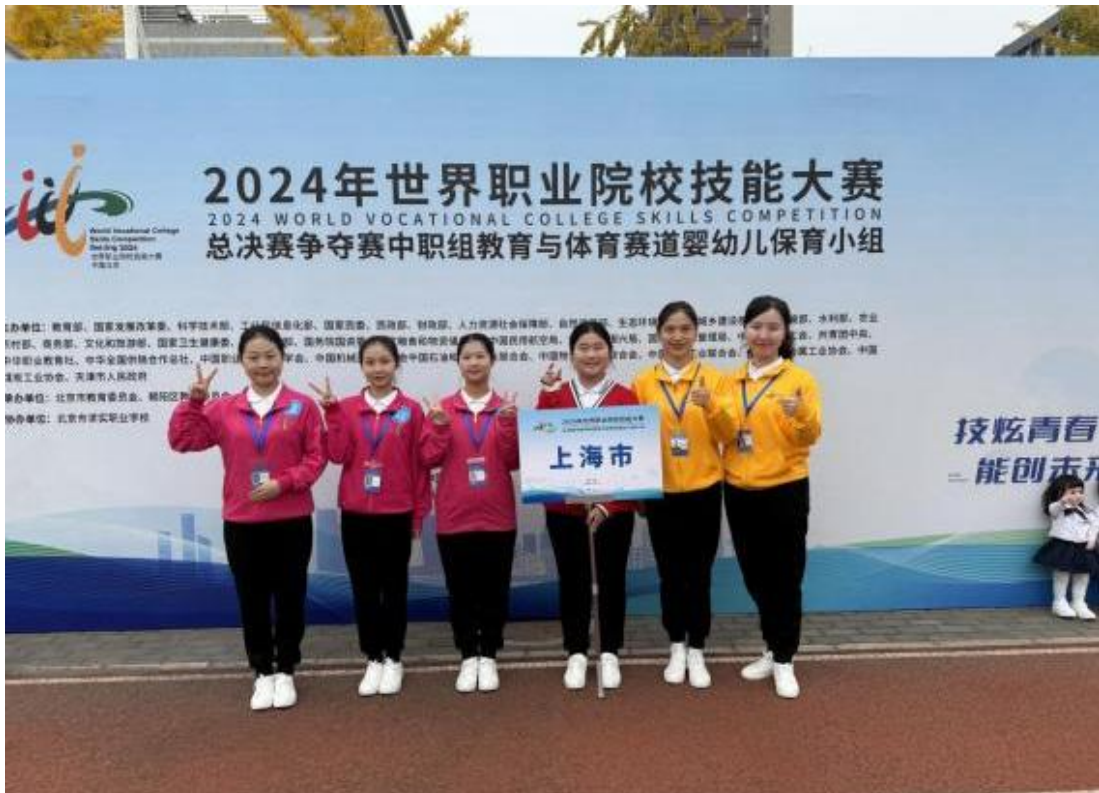
图 4：2024 年世界职业院校技能大赛总决赛赛场上的师生团队

身丰富经验，为选手们提供了专业的指导与建议。赛事模拟真实的工作情境，注重参赛队伍在婴幼儿保育技能要点上的综合表现，强调团队成员的分工协作。经过不懈努力，同学们最终荣获铜奖。比赛所取得的成绩，不仅是对选手们辛勤付出的最好回报，也是对学校教育教学质量和职业教育水平的有力证明。未来，中华职业学校将继续秉承“以赛促学、以赛促教”的正确理念，不断推动职业教育的发展与创新，为社会培养更多高素质技能型人才。