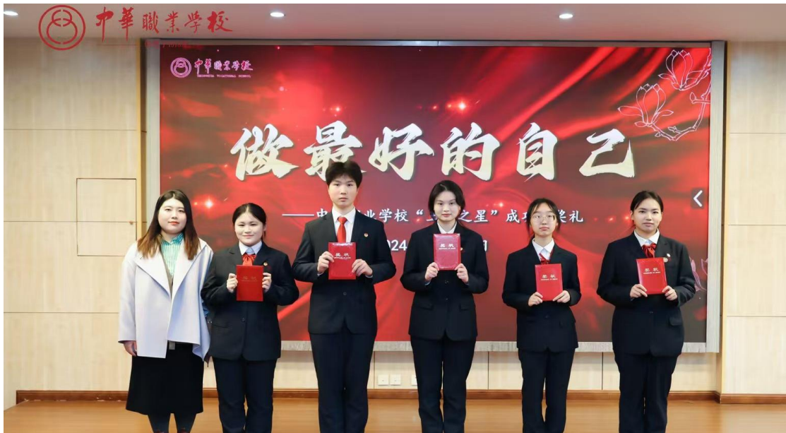
图 3：2024 学年第一学期学生颁奖礼

升旗仪式开展《把握新机遇 筑梦新征程》《春来梦启 青春绽放》开学典礼，《无烟校园 你我共建》《以法治护航爱国主义教育》《国家安全 青春挺膺》《改革有召唤 青年有担当》等主题宣讲；团委开展学雷锋、纪念“五四”运动 105 周年等主题团日活动，举办入团仪式、学生会年度总结大会、“‘易’路心相随 青春永奋进”中职易班迎新系列进校园等活动。