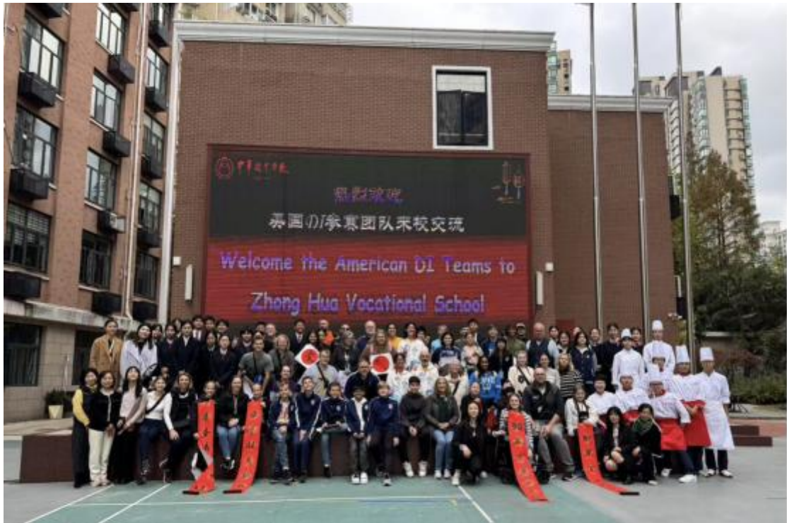
图 16：上海青少年创新思维竞赛暨国际邀请赛美国队来校参观访问