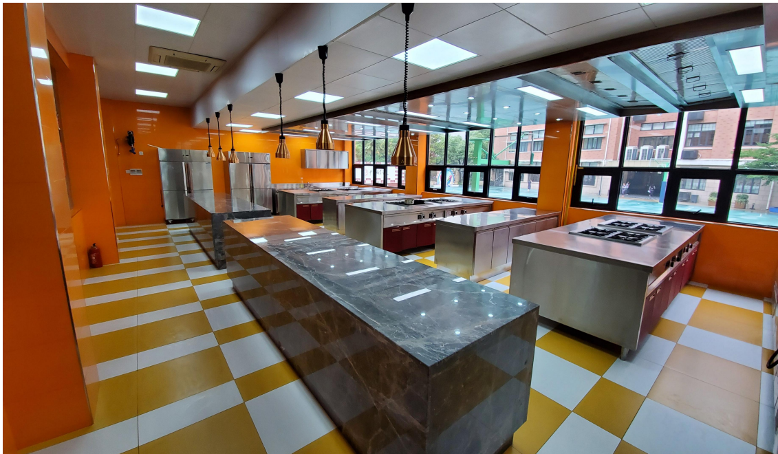
图9：智慧烹饪开放实训中心西班牙主题西餐实训室

宽他们的就业创业渠道，提升产业工人的整体素质；发展国际交流与合作，承担中国对外承包商会对德厨师劳务合作的培训考核工作，与上海第二工业大学合作开展“中华餐饮文化项目”上海暑期学校。作为第47届世界技能大赛烹饪西餐项目上海市集训基地，组建了凝聚力强、工作效率高的基地保障团队。今后，学校将继续通过加强基础条件建设、师资队伍建设、课程资源建设、教育教学改革等措施，围绕烹饪专业人才供应、产学研协同创新等重点任务，校企合作共建，着力建设满足“职前教育、职后培训、技能认定”为一体的具有专业特点、上海特色、示范作用的现代化智慧烹饪开放实训中心，服务经济发展，服务新质生产力发展。