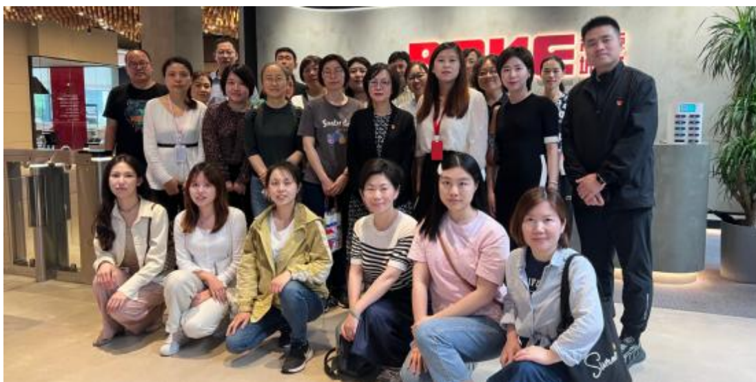
图 7：文化创意专业群教学团队走访“波克城市”

素养和信息化教学能力。2024 年完成“双师型”教师认定工作，认定高级 5 人、中级 3 人、初级 31 人。6 月组织全体教师分专业参观企业。暑期落实 12 名教师市级企业实践、4 名教师校级企业实践，下半年 1 名教师市级脱产企业实践。